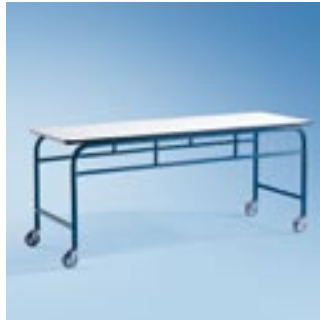
Abb. zeigt MB 03