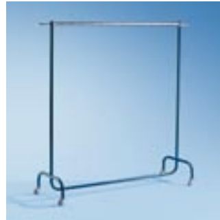
Abb. zeigt MTR 2 (F)